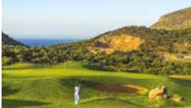
The Crete Golf Club

Víme, jaké hotely jsou dobré, pokud jedete s rodinou, s partou chlapů anebo v páru. Máme vynikající vztahy s řediteli hotelů, takže kdyby se vám cokoli stalo, umíme vám pomoci, popřípadě pro vás získat nějaké výhody navíc.“